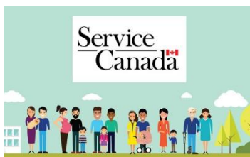
Assurance emploi - Gouvernement du Canada